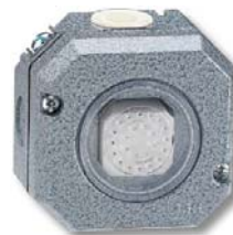
Obr. 2: Spínač osazený průchodkou