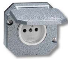
Obr. 4: Zásuvka pro polozapuštěnou montáž