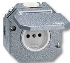
Obr. 3: Zásuvka pro vrchní montáž

Přístroje řady Garant se používají pro vrchní pevné elektroinstalace v prostředí, kde je vyžadováno krytí až do IP 55 u zásuvek a IP 66 u spínačů. Přístroje jsou vhodné pro instalaci na hořlavé podklady o třídách reakce na oheň A2, B, C, D.